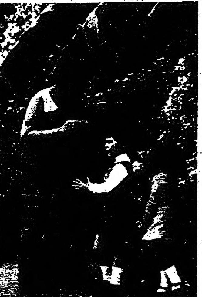
انديرا غاندي مع ضحاياها

وام تذكر غاندي كم يوما ستسير حالة الطوارئ ، ولكنها تابل يسجل بعض الوضع الداخلي قريبا بصحبة يرع برسم الطوارئ الذي يسجل الحكومة صلاحيات واسعة لاتعتقل وتوقيف الأشخاص دون محاكمة . وكانت حالة الطوارئ قد فرضت في الهند في الماضي في زمن الحرب . في عام ١٩٦٢ عندما نشبت الحرب مع الصين ، وفي كانون الاول عام ١٩٧١ عندما نشبت الحرب مع باكستان حول بنغلادش .